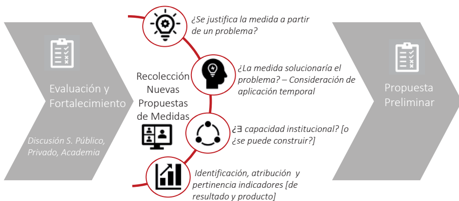
Gráfico 1. Proceso para la selección y fortalecimiento de las propuestas de medidas para la actualización

Elaboración: Propia a partir de Crespi et al. (2014).